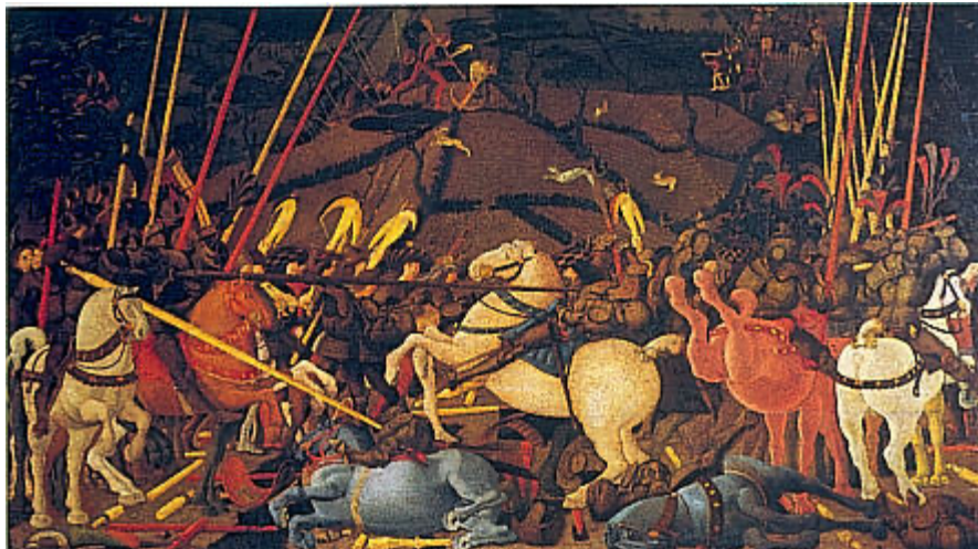
Galleria Degli Uffizzi, Florencia

En la tabla de los Uffizi se representa el momento más álgido e intenso de la disputa y la conclusión de la batalla.