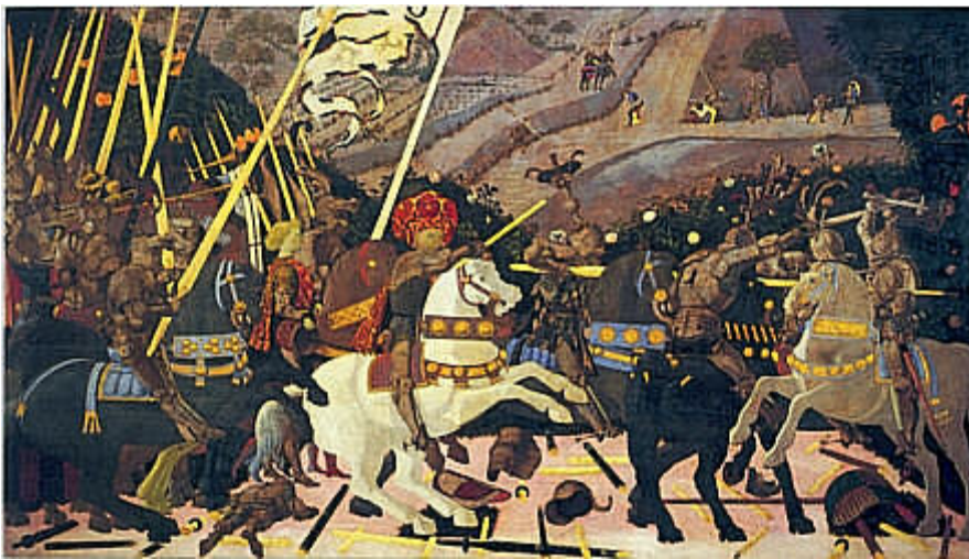
National Gallery de Londres

La tabla expuesta en la National Gallery de Londres celebra a Niccoló Mauruzi da Tolentino, capitán mercenario aliado y amigo de Cosme el Viejo de Médicis. Paolo Uccello lo representa con los signos del poder y los presentes que la Signoria florentina le concedió el día de San Juan (21 de junio) de 1433, un año después de la batalla de San Romano. El acontecimiento es mencionado en una oración de Leonardo Bruní, donde se recuerdan el bastón de mando, las ropas “purpúreas y doradas” de Niccoló y el paje y el yelmo llevado por este último.