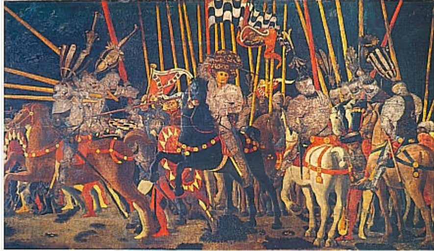
Musée du Louvre, Paris